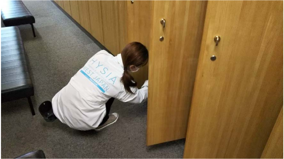
③ ナノレベルの薄いガラス膜（薬剤）で覆う